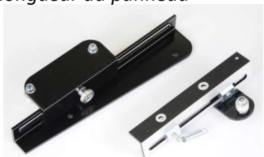
Accessoires pour la découpe biaisée sur toute la longueur du panneau