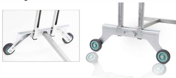
Pied réglable en hauteur