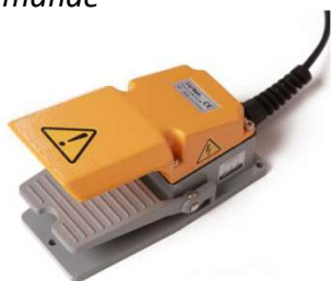
Pédale de commande