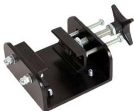
Support d'échafaudage :