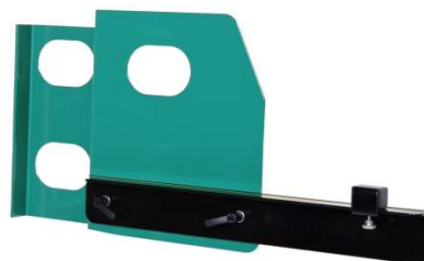
Support latéral droit avec butée :