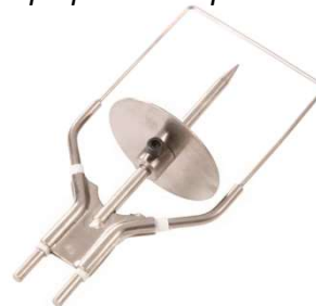
Outil de découpe pour bloc prise