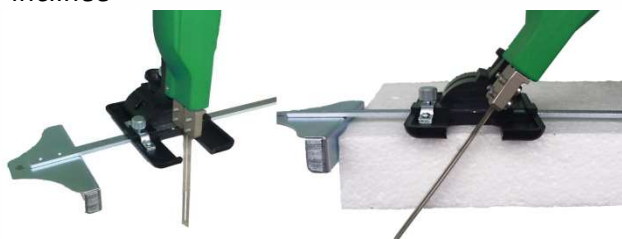
Chariot de découpe linéaire, droite et inclinée