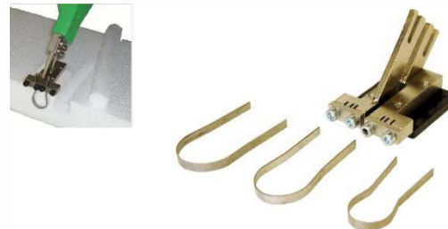
Chariot à encastrer les ICT